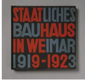
Reflex Bauhaus 29.