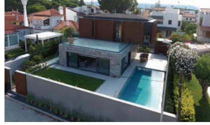
BY Evi 76.