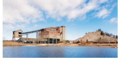
KAOS Arhitektid 36.