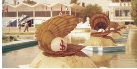
Yılmaz Zenger Üzerine Notlar 94.