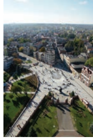
Biuro Toprojekt 68.