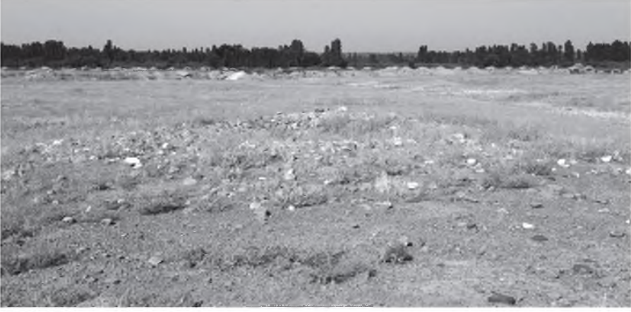
Resim 6: Yukarı Çarıklı kurgan (Kurgan 5)