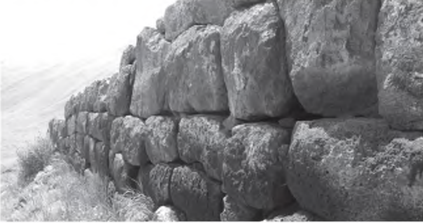
Resim 14: Korhan Kalesi