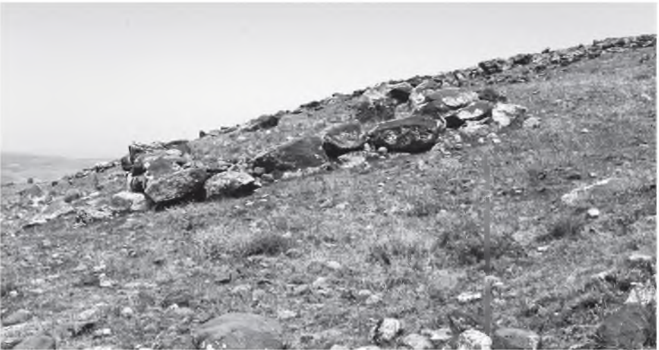
Resim 12: Gelenge Kalesi