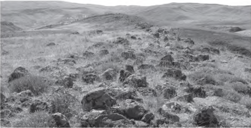
Resim 3: Hacıkale