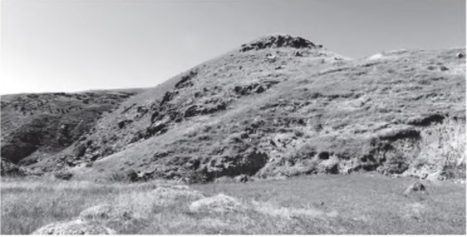
Resim 4: Devetaşı Kalesi