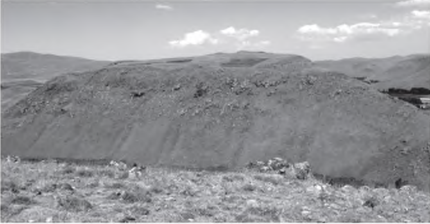
Resim 2: Hacıkale