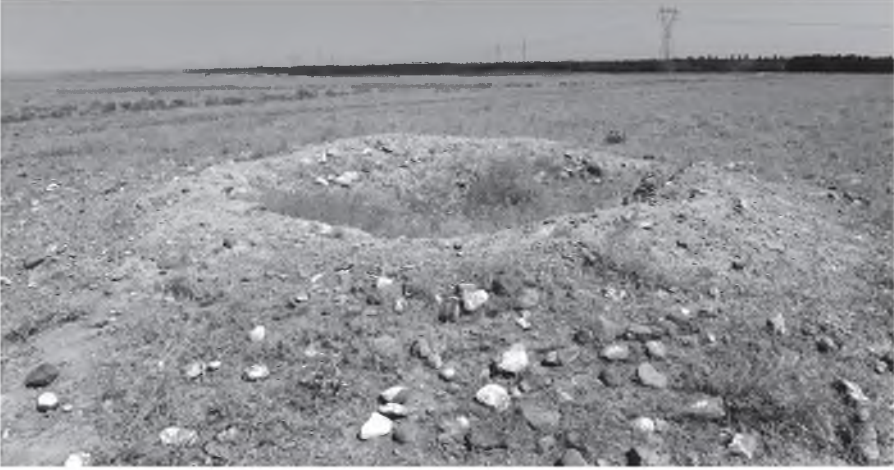
Resim 7: Yukarı Çarıklı kurgan (Kurgan 11)