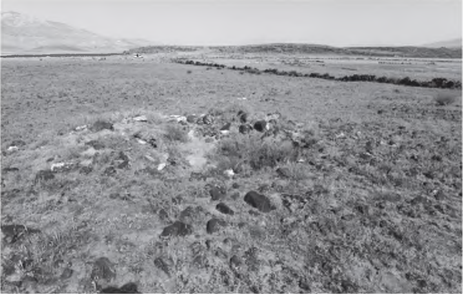
Resim 5: Yaygınyurt kurgan