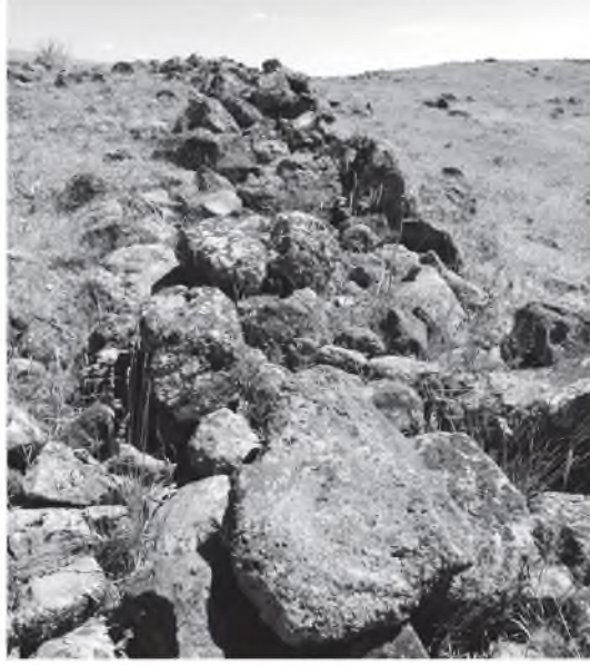
Resim 9: Görecek Kalesi