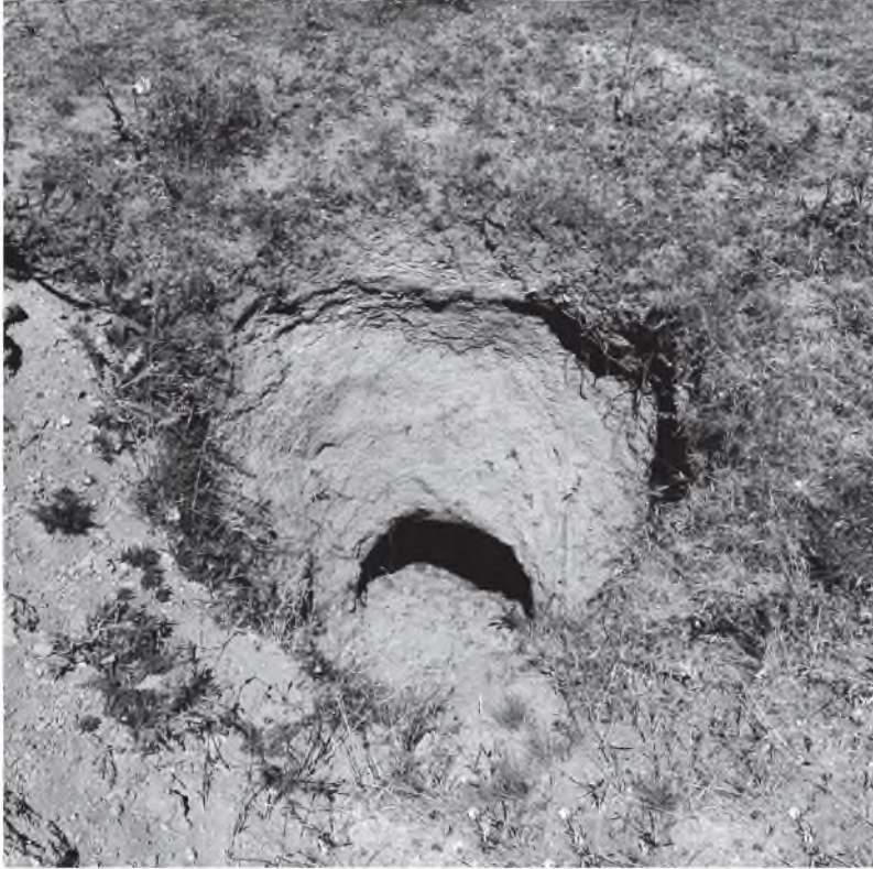
Resim 10: Görecek Kalesi, Mezar 4