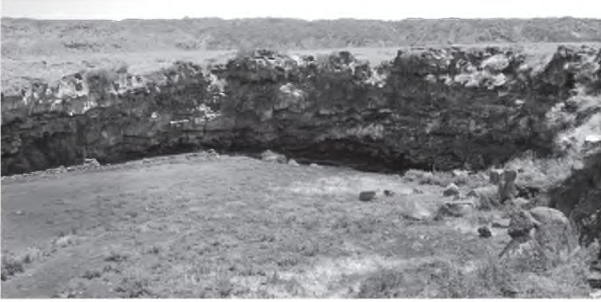
Resim 1: Kaderçavuş Mağarası