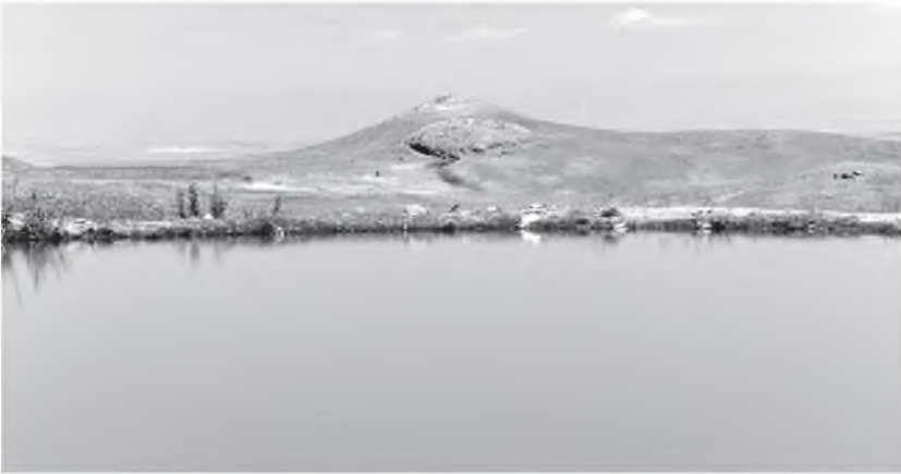
Resim 15: Beyaztaş Kalesi