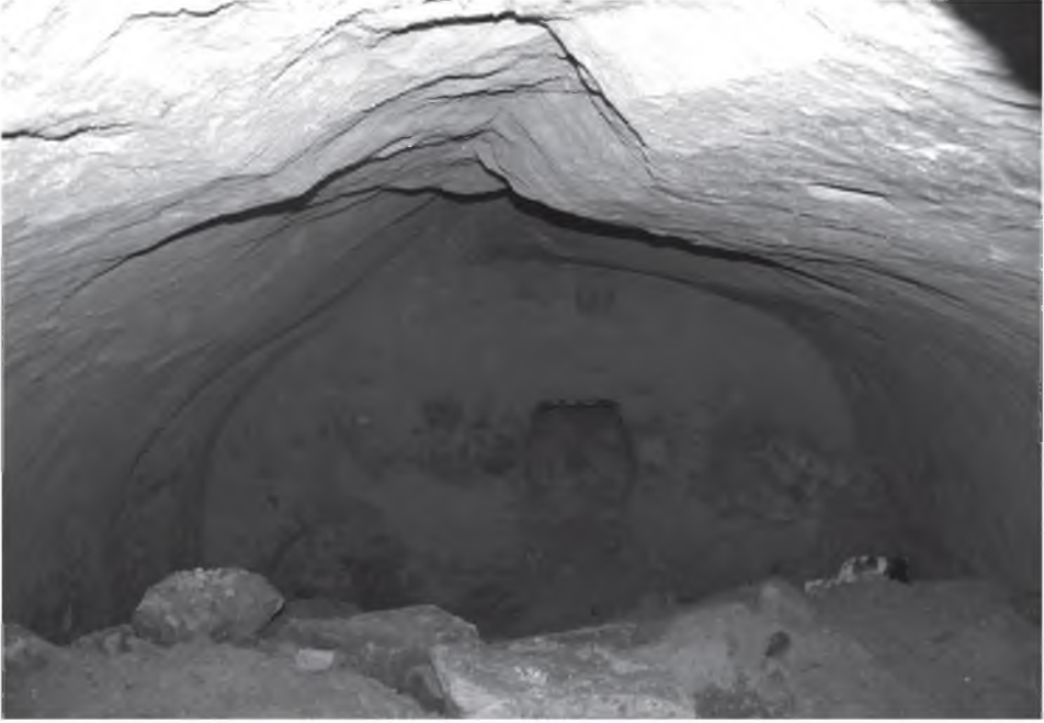
Resim 11: Görecek Kalesi, Mezar 1