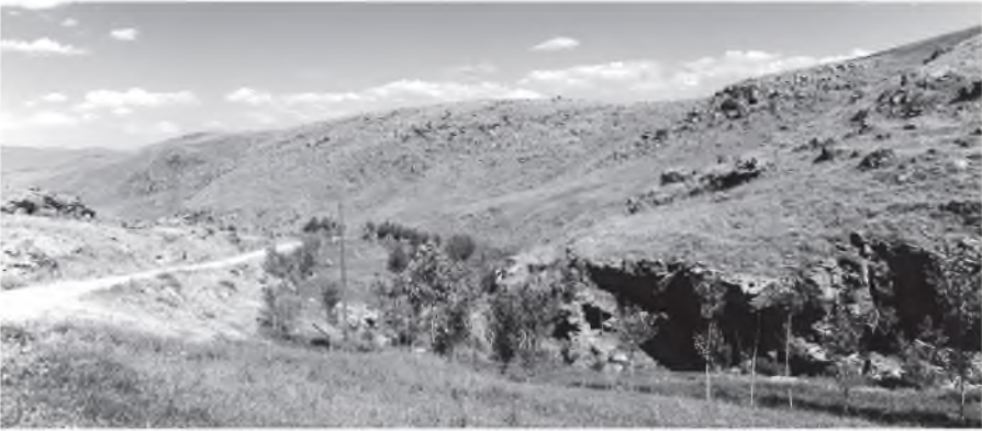
Resim 8: Görecek Kalesi