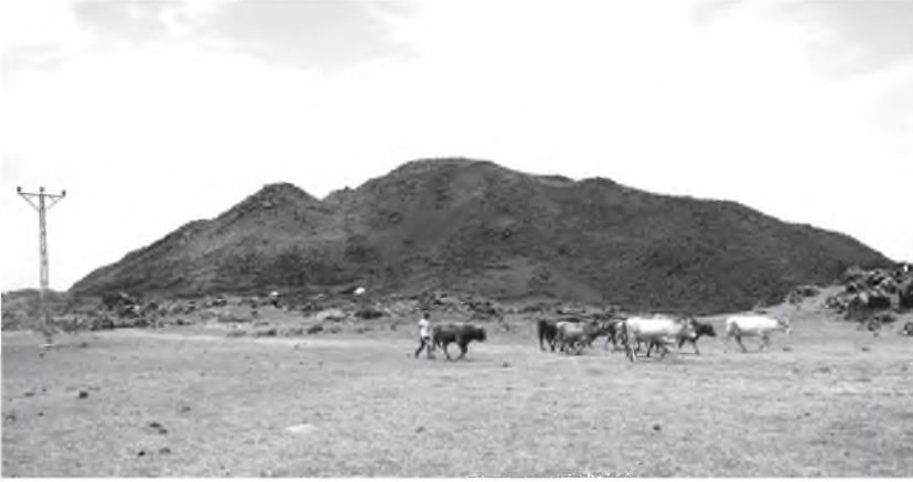
Resim 13: Korhan Kalesi