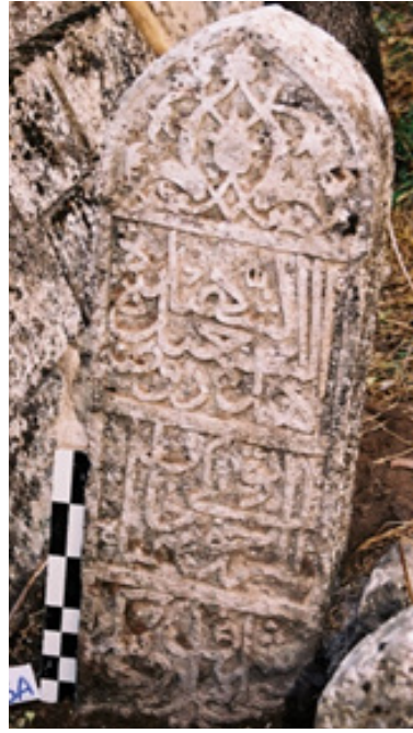
Fotoğraf 3-4: Batman Kozluk- Şahbeyi Hatun binti Ali Bey'in Baş Şahidesi İç ve Dış Yüzü (A. Boran'dan)