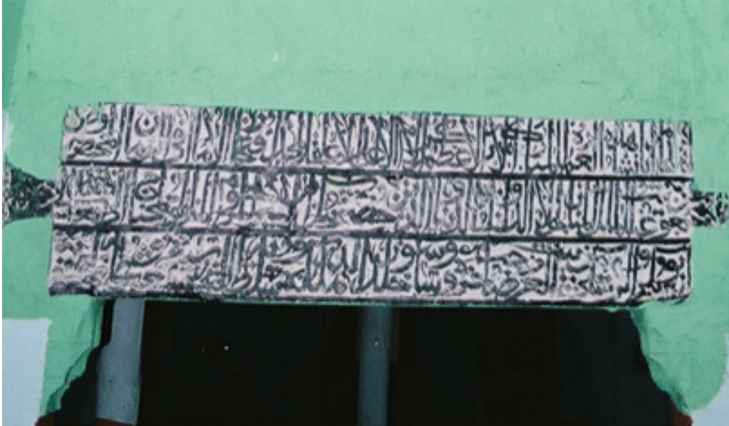
Fotoğraf 2: Batman Kozluk (Hazo) Hıdır Bey Cami İnşaa Kitabesi (A. Boran'dan)