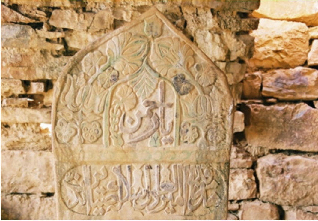
Fotoğraf 7: Derzin Kalesi, I. Türbedeki Muhammed Halef Bey'in Baş Şahidesi (A. Boran'dan)