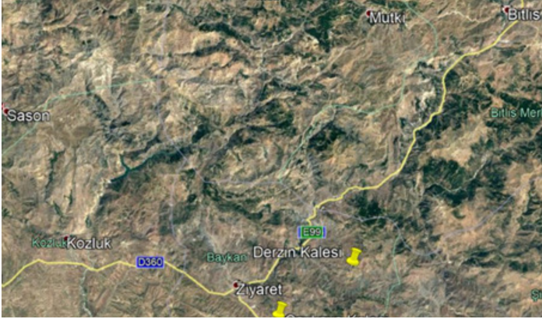
Fotoğraf 1: Siirt/Baykan- Batman/Kozluk Bölgesi Haritası (googleearth'den)