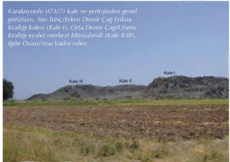
Karakoyunlu (I73/7) kale ve yerleşimleri genel görünüm, Son Tunç/Erken Demir Çağ Erikua Krallığı kalesi (Kale I), Orta Demir Çağ/Urartu Krallığı eyalet merkezi Minuahinili (Kale II-III), Iğdır Ovası/Aras Vadisi'nden.