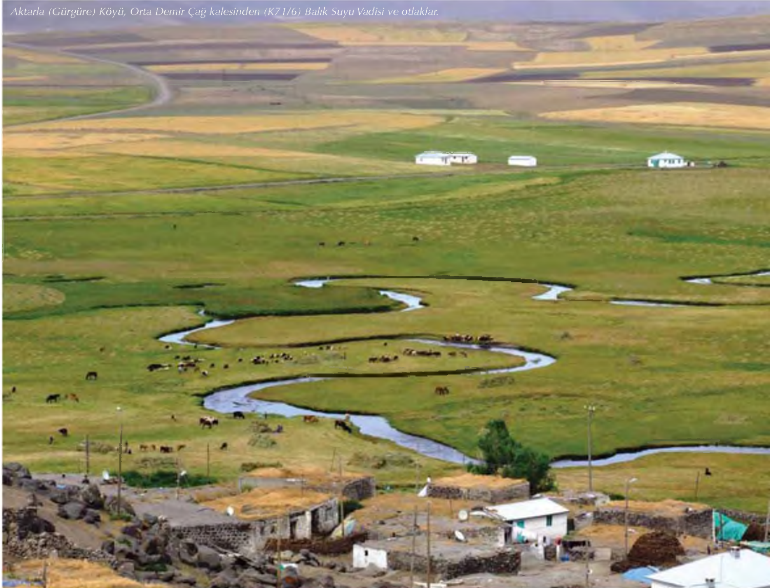
Aktarla (Gürgüre) Köyü, Orta Demir Çağ kalesinden (K71/6) Balık Suyu Vadisi ve otlaklar.