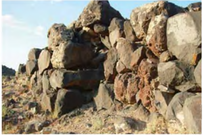
Ömerağa kalesi (K73/1) batı duvarı.