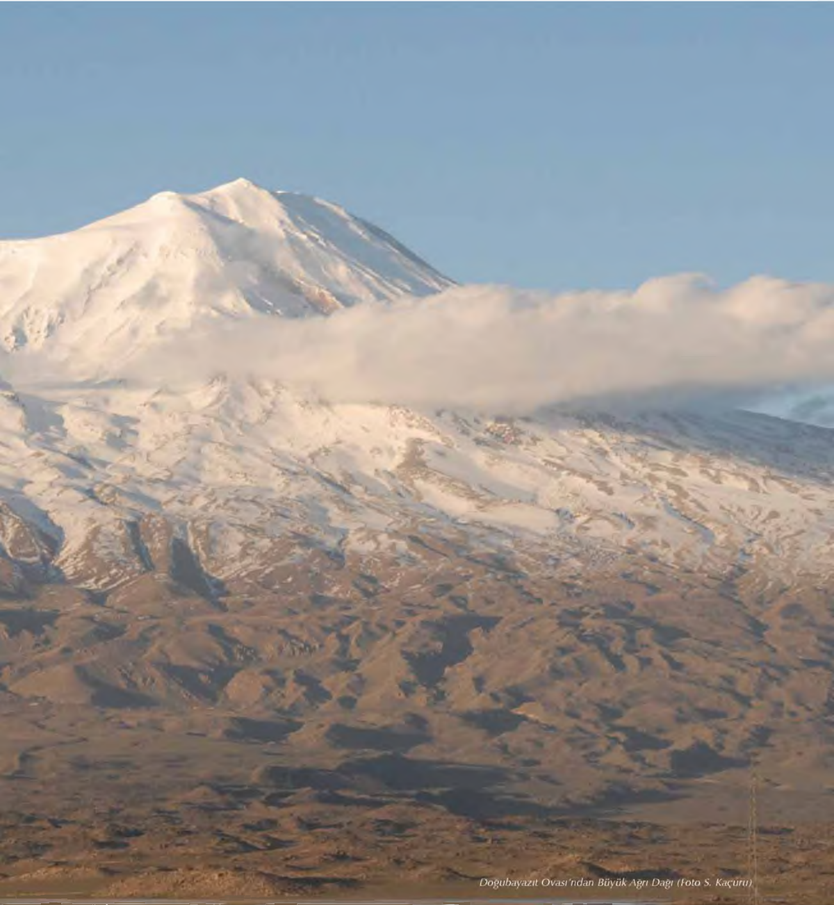
Doğubayazıt Ovası'ndan Büyük Ağrı Dağı