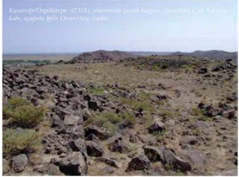
Kasıntıği/Orgületepe (173/31), platinimle çevrili kurgan. Orta Tunç Çağ kurganları, aşağıda Iğdır Ovası/Aras Vadisi.

Son Tunç/Erken Demir Çağında (yaklaşık MÖ 1400/1300-900) ise yine tüm Kafkasya ve Doğu Anadolu yüksek yaylasında olduğu gibi önemli değişiklikler ortaya çıkmıştır. Orta Tunç Çağında kurgan kültürlerinin girişiyle kesin-tiye uğrayan yerleşik yaşam tekrar başlamış görünür. Bu dönemin en dikkat çekici özelliği, çok sayıda kalenin varlığı ve buna bağlı olarak artan nüfustur. Kaleler ve eteklerinde yer alan geniş alanlara yayılmış kurgan mezarlıklarının gösterdiği gibi bölge, eskiye göre çok