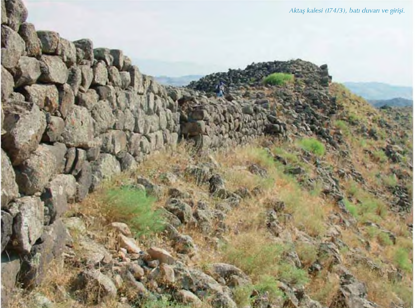
Aktaş kalesi (174/3), batı duvarı ve girişi.

** Bozkurt-Kurgan Nekropolü Kazı ve Yüzey Araştırması, T.C. Kültür Varlıkları ve Müzeler Genel Müdürlüğü'nün izin ve destekleriyle gerçekleştirilmektedir. Ağrı Valiği ve Doğubayazıt Kaymakamlığı'nın yanı sıra Mustafa Kemal Üniversitesi Bilimsel Araştırma Projeleri Başkanlığı ve Türk Tarih Kurumu projeleriyle de çalışmalarımız desteklenmektedir. Her iki çalışma, ayrıca TÜBİTAK projeleri çerçevesinde çalışılmıştır. Tüm bu kurumlara teşekkür bizim için zevkli bir görevdir.