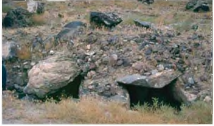
Kasımtığı (I73/3) kurgan, Son Tunç/Erken Demir Çağ.