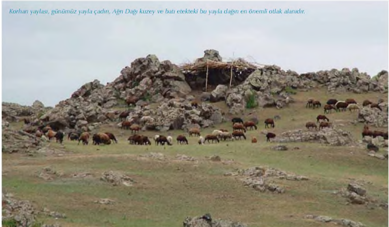
Korhan yaylası, günümüz yayla çadırı, Ağrı Dağı kuzey ve batı eteklerdeki bu yayla dağın en önemli otlak alanıdır.