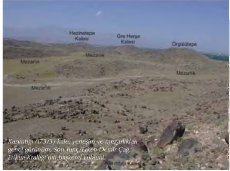
Kasımtığı (I73/3) kale, yerleşim ve mezarlıkları genel görünüm, Son Tunç/Erken Demir Çağ, Erikua Krallığı'nın başkenti Lühiuni.

Ağrı Dağı coğrafi olarak kuzeyinde Iğdır Ovası/Aras Vadisi, güneyinde ise Doğubayazıt Ovası'yla çevrilidir. Bu ovaları çevreleyen lavlarla kaplı geniş eteklerine ise birçok yerleşim yeri serpilmiştir. Bu yerleşimler dağın lav akıntılarının ovaya birleştiği noktalardadır; çoğunluğu ve en önemlileri ise dağın kuzey eteğinde ve aynı zamanda bölgenin en verimli tarım alanı olan Iğdır Ovası/Aras Vadisi yönündedir. Dağ eteğindeki bu merkezler dışında, bölgede az sayıda da olsa höyükler görülür. Höyükler çoğu kez ovalarda yükselir, bir kısmı ise ovaların içine değin uzanan ve en alt seviyedeki alçak lav tepeleri üzerinde konuşlanmışlardır. Geç Kalkolitik (yaklaşık MÖ 3750-3400) ve İlk Tunç Çağına (yaklaşık MÖ 3400-2300/2200) ait erken yerleşimler bu alanlarda yer alır. Dağın tüm eteğine yayılmış bulunan kaleler ve eteklerindeki düzlüklerde yer alan mezarlıklar ise kısmen Orta Tunç Çağında görülmeye başlamışsa da (yaklaşık MÖ 2300/2200-1400/1300) büyük oranda Son Tunç/Erken Demir Çağında (yaklaşık MÖ 1400/1300-900) başlayarak iskan edilmişlerdir. Aslında bu yerleşim sistemi, Doğu Anadolu yüksek yaylasının tümü için geçerli görünür; ancak Ağrı Dağı eteklerinde yer alanlar, boyutları, geniş alanlara yayılmış aşağı kentleri ve uzun süreli kullanımlarıyla bölgenin kalanından ayrılır. Kalelerin eteklerindeki düzlüklerde yer alan mezarlıklardaki gömü türü ise Orta Asya ve Kafkasya'dan iyi bilinen kurgan türündedir.