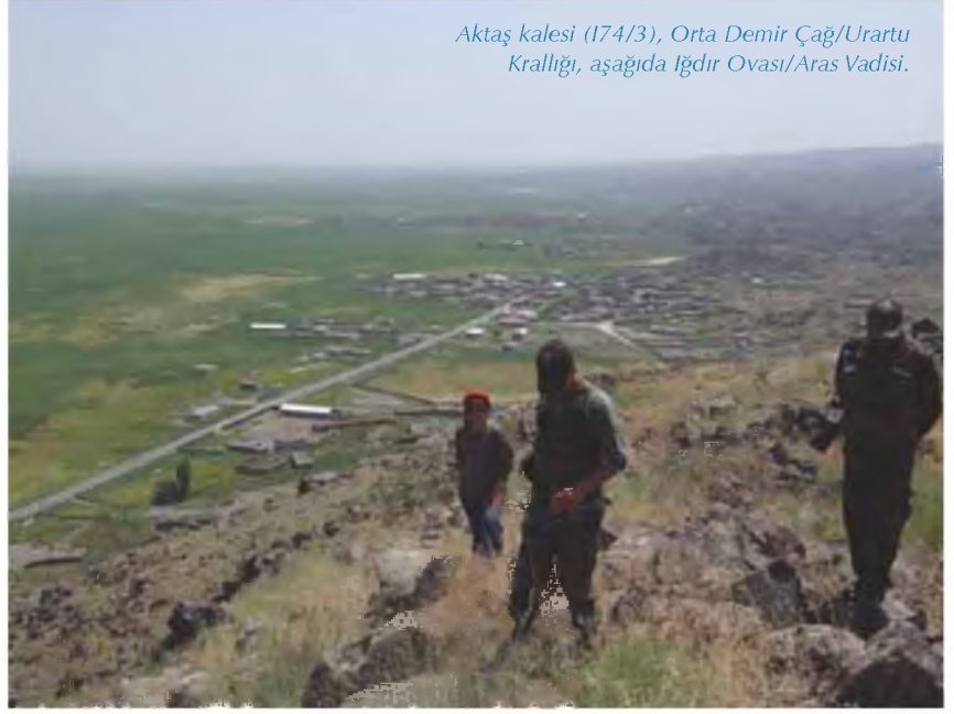
Aktaş kalesi (174/3), Orta Demir Çağ/Urartu Krallığı, aşağıda İğdır Ovası/Aras Vadisi.