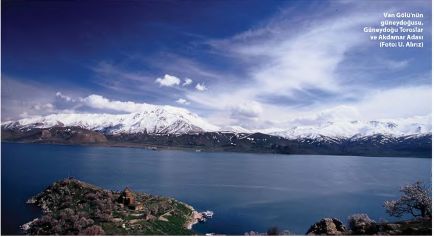
Van Gölü'nün güneydoğusu, Güneydoğu Toroslar ve Akdamar Adası

Yazı ve Fotoğraflar; Prof. Dr. Aynur ÖZFIRAT Mustafa Kemal Üniversitesi Arkeoloji Bölümü