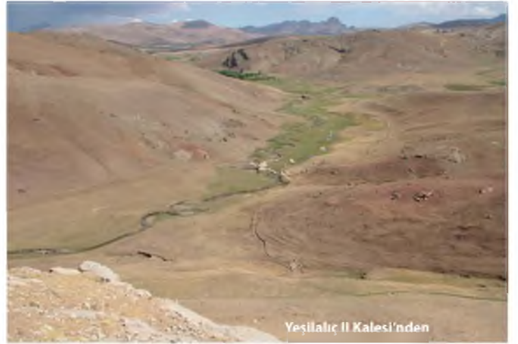
Yeşilalıç II Kalesi'nden

neydoğusunda dağlık alandaki Yeşilalıç II, güneyindeki Gelenge, Gürpınar İran yolu üzerindeki Bajergeh ve Gavurkale, Çaldıran Ovasının doğusundaki Ziyaret/Alikelle, kuzeyde Aladağ eteklerindeki Bakırtaş, Teketaş ve Şekerbulak, Patnos Ovası'nın doğusundaki Kartavin ve Ch. Burney tarafından incelenmiş olan Süphan Dağı'nın doğu eteğindeki Kefir kalesidir. Bunların içinde Gelenge, Yeşilalıç II ve Kartavin kaleleri Urartu'ya çok daha yakın inşa teknikleri nedeniyle erken örnekler olmalıdır. Diğerleri, daha küçük taşlarla özensiz inşa edilmiş duvarları ve daha basit plan anlayışlarıyla ayrılır, bunların biraz daha geç bir evreye ait oldukları kabul edilebilir. Aslında bugüne kadar Doğu Anadolu'da araştırmalarda söz konusu dönemlere ilişkin bazı izlere rastlanmış, yerleşme dokusu ve çanak çömlek özellikleri konusunda bazı bilgilere ulaşılmıştır. Van Kalesi ve Karagündüz höyükleri ile Çavuştepe kalesi kazılarında bu döneme ait tabakalara rastlanmıştır, ancak bunlar oldukça zayıftır. Bu döneme ait arkeolojik bulgular, daha çok, dağlık alanlarda yer alan kalelerdir. Kalelerde az sayıda olmakla birlikte tüm bu yerleşim-